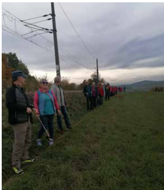
Wanderung entlang des Panorama- weges in Katsdorf