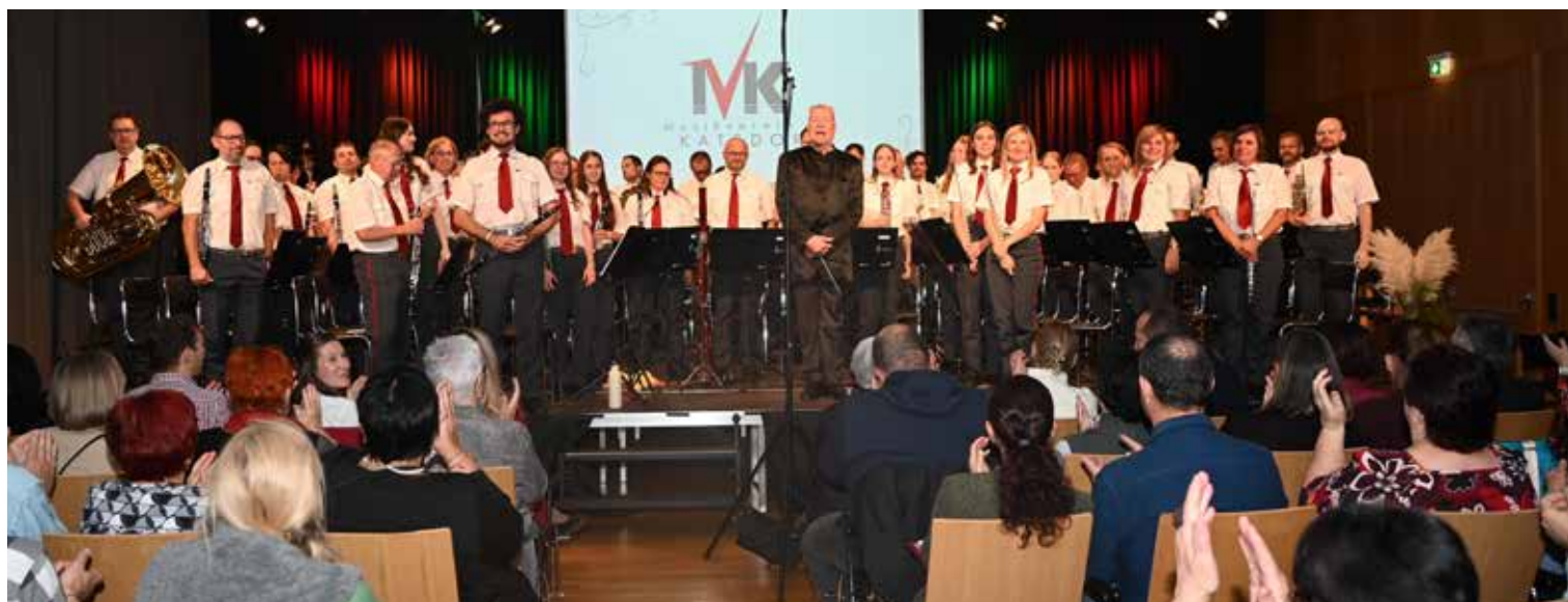
Herbstkonzert des Musikvereins Katsdorf