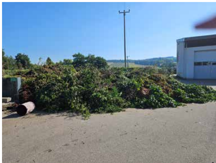
Grünschnitt am Katsdorfer Bauhof

Wenn ihr wissen wollt, wie ihr bei den Stromkosten sparen könnt, dann reserviert euch den Termin und besucht unsere Veranstaltung.