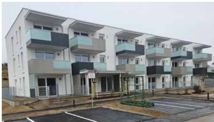
Wohnprojekt am Sonnenhang

Wir wünschen allen Mieter*innen alles Gute, Gesundheit und Zufriedenheit im neuen Zuhause.