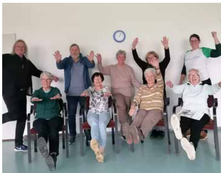
Teilnehmer*innen des Sturzpräventionskurses „Trittsicher & aktiv“

Es freut mich, dass wir seit August den 12-wöchigen kostenlosen Sturzpräventionskurs „ Trittsicher & aktiv “ im ASKÖ Sportheim abhalten konnten. Acht Mitglieder nahmen daran teil.