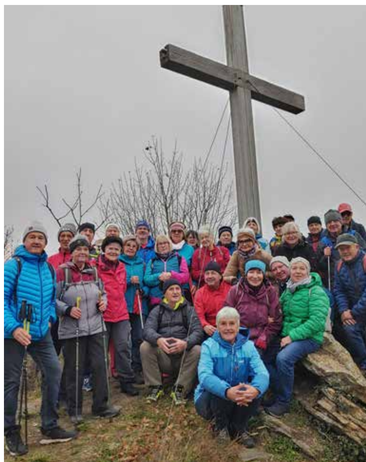
Gipfelfoto vom 1000-Eimer-Berg

Unsere Abschlusswanderung mit Heurigenbesuch in der Wachau fand am 13. November statt. Mit dem Bus fuhren wir um 10 Uhr nach Spitz. Für die Wanderer ging es rund um den 1000-Eimerberg, für die Nicht-Wanderer gab es die Möglichkeit zu einem Spaziergang in Spitz.