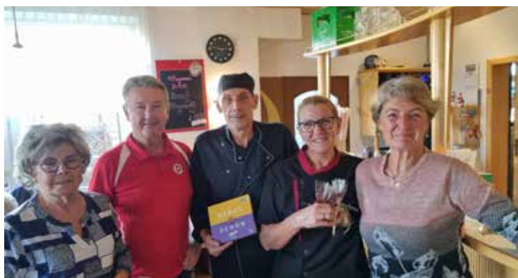
Danke-Essen auf der ASKÖ-Sportanlage

Ca. 50 Helferinnen und Helfer sowie die Funktionär*innen der Ortsgruppe Katsdorf wurden für ihre Mithilfe bei den verschiedenen Veranstaltungen zu einem Essen und Getränk eingeladen.