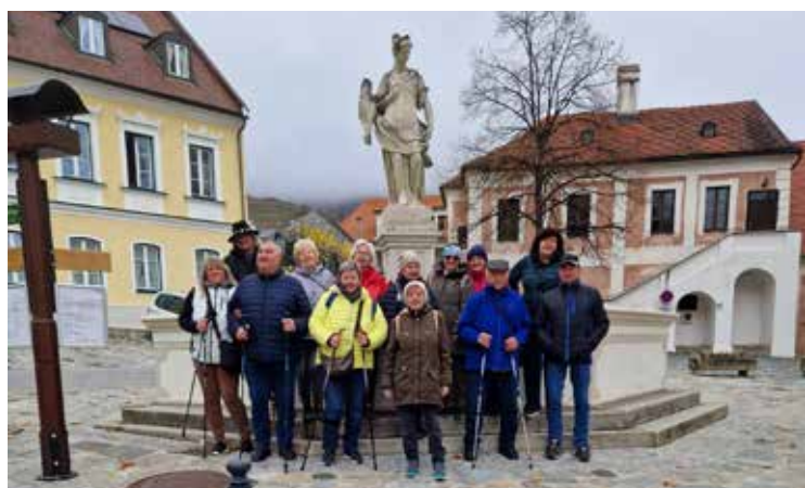
Abschluss-Wanderung in der Wachau