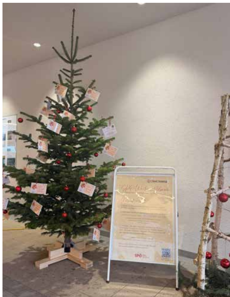
Unser Weihnachtsbaum am Katsdorfer Adventmarkt

Das Team der SPÖ Katsdorf bedankt sich bei all jenen, die sich an der Spendenaktion beteiligen und wünscht schöne Feiertage!